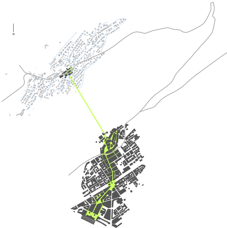
Evilard - Biel Stadtzentrum Mst. 1/30'000