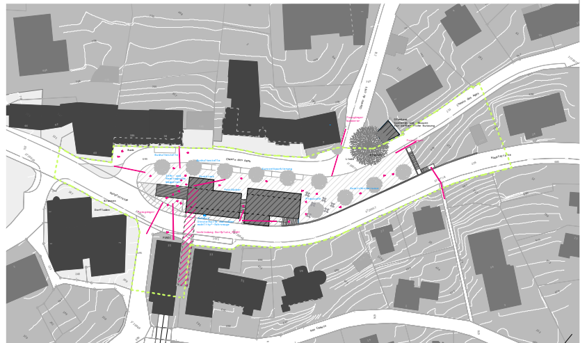
Dorfkern Evilard Mst. 1/2000