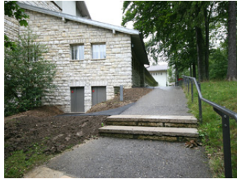
neuer Zugang Toiletten Public