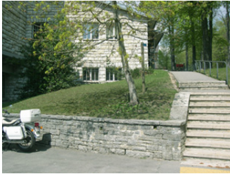
Aussenansicht vor Umbau