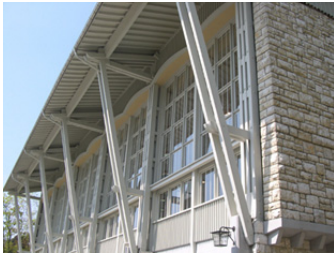
Südensicht alte Sporthalle

BASPO Magglingen End der Welt-Strasse 1, 2532 Magglingen Bundesamt für Bauten und Logistik BBL