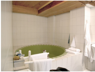
Badezimmer vor dem Umbau

Umbau Badezimmer Bärenlände 6, 2513 Twann Ursula & Bramwell Kaltenrieder