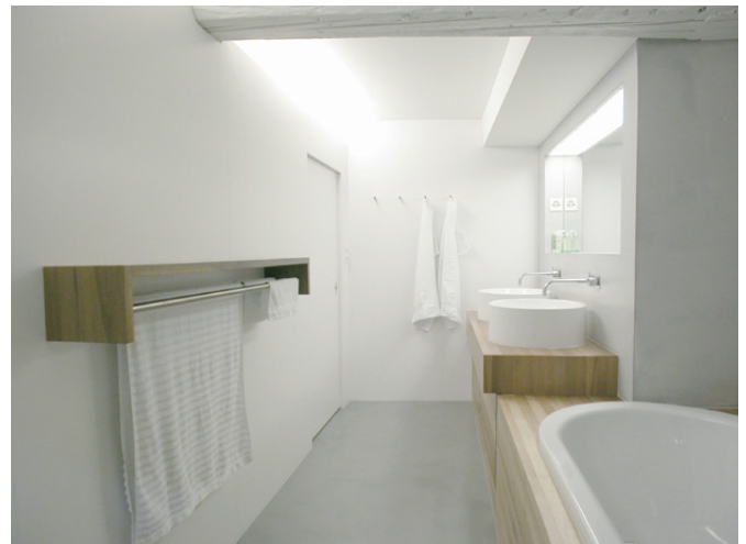
neues Badezimmer, Blick vom Fenster