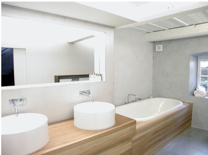
neues Badezimmer, Blick von der Türe

Boden, fugenloser Bodenbelag SOLUM Wandverputz, fugenlose Abglättung PALUM Wandverkleidung, MDF mit Pinselbstrich Decke, best. Holzboden mit Pinselbstrich Untermöbel, europ. Nussbaum 4x geölt Apparate und Armaturen, ALAPE / VOLA / V&B