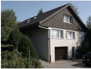
Westfassade, Vorher / Nachher