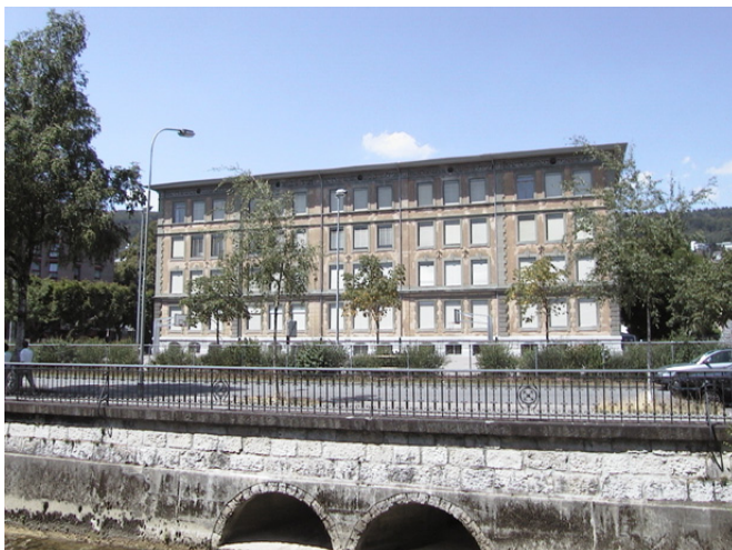
Südfassade Neumarktschulhaus, Stand 2004