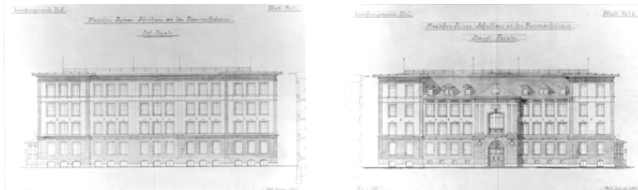
Schulhaus Neumarktstr. 15 (1889), Fassadenpläne Aufstockung 1901

Sanierung, Erweiterung und Umbau Schulanlage Neumarktstrasse 15, Logengasse 2, Logengasse 4, 2502 Biel Hochbauamt der Stadt Biel