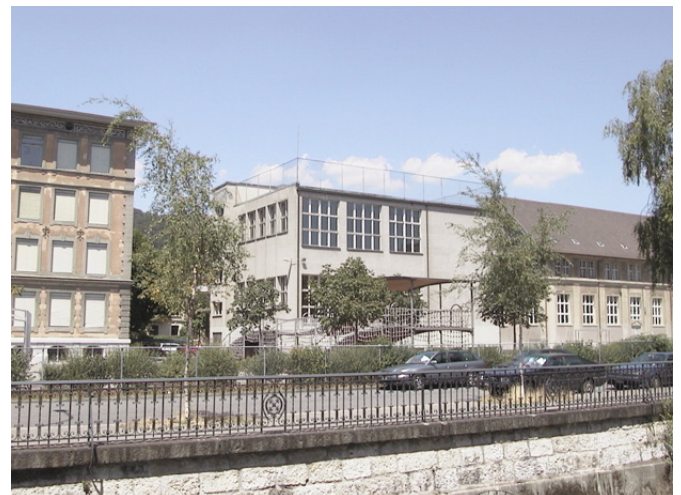
Südfassade Logengasse 2 + 4, Stand 2004