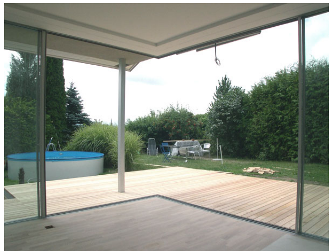
Wohnzimmer mit geöffneter Fensterfront