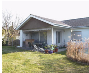
Bestehende Situation: Wohnzimmer und Südwestfassade