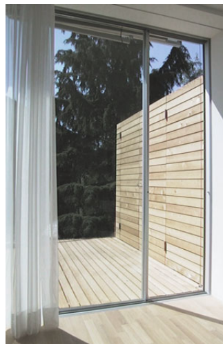
Wohnzimmer / Terrasse / Geräteschrank