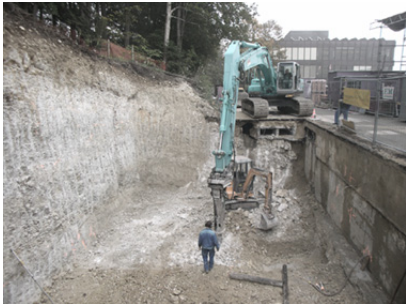
Baugrubenaushub im Fels

Einbau Garderobenanlage Hauptstrasse 247, 2532 Magglingen Bundesamt für Bauten und Logistik BBL