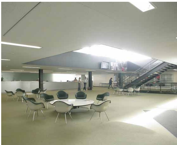
Ankunft Ebene 3

Die bestehende Anlage besitzt eine hohe architektonische Qualität und die Einbindung in die Landschaft und das Terrain stimmt. Die bestehende Anlage soll unter Aufwertung der Licht- und Stimmungsverhältnisse verdichtet werden. Durch das Einfügen eines die Ebene 3 und 2 durchdringenden Lichtkörpers wird einerseits Tageslicht ins Gebäudeinnere geführt, andererseits aber auch eine neue Identität erzielt. Der Lichtkörper zeigt sich auf der Terrasse, schafft eine Verbindung zwischen Aussen und Innen und erleichtert die Orientierung im Gebäude. Durch die Verbreiterung der entlang der Fassade angeordneten Bürozone können die Arbeitsplätze zweireihig angeordnet werden. Dadurch wird die Nutzfläche optimiert und effizienter genutzt. Im Innenbereich der Ebenen 2 und 3 entsteht eine Zone mit Backofficefunktionen.