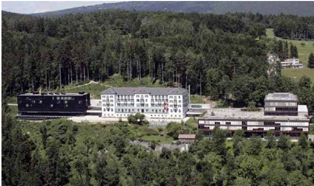
Luftaufnahme BASPO Magglingen

Gesamtsanierung und Optimierung Hauptstrasse 247, 2532 Magglingen Bundesamt für Bauten und Logistik BBL