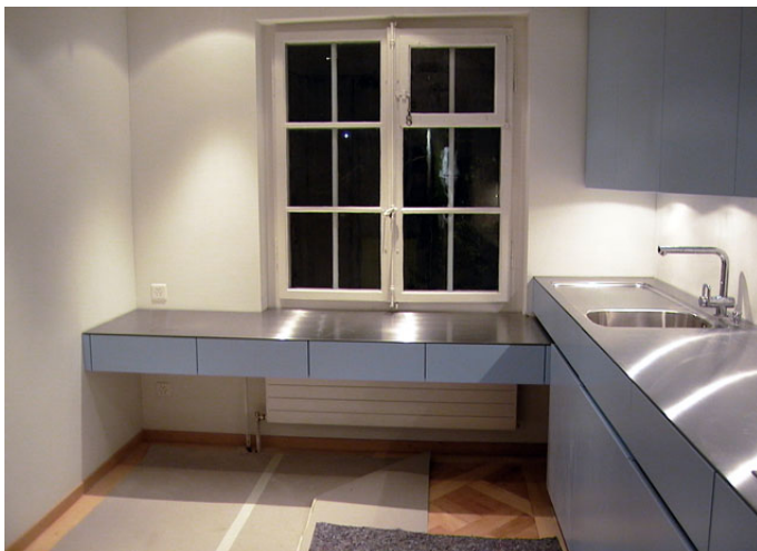
Küche im Erdgeschoss

Das Haus bleibt in seiner Struktur und äusseren Erscheinung wie bisher erhalten. Der Bereich des heutigen Wohn- und Esszimmer wird durch das Entfernen der Trennwände sehr grosszügig gestaltet. Um die gegebene Dreiteiligkeit des Raumes zu respektieren wird mit der Bodengestaltung und der Ausbildung der neuen Wandfront darauf eingegangen. Der Zugang zum Raum wird neu in der Achse angeordnet und entspricht der Grösse der Fenstertüre auf die Terrasse. An beiden Enden der Wandverkleidung sollen Indirektleuchten eingebaut werden. Diese markieren den Eingriff in die bestehende Struktur. Die Küche wird mit einem Durchgang in das Esszimmer geöffnet, bleibt aber durch eine Schiebetüre abtrennbar. Die Küche wird komplett in moderner Bauweise ersetzt. Die Sanitärinstallationen entsprechen nicht mehr dem neusten Stand und müssen erneuert werden. Auch die Nassräume wurden komplett neu gestaltet. Das Einbauen einer Dusche in das WC im 2.Obergeschoss ist trotz engen Platzverhältnissen realisiert worden. Die Wärmeerzeugung soll im Zuge der Umbauarbeiten erneuert werden.