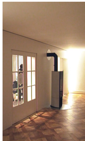
Wohnzimmer im Erdgeschoss