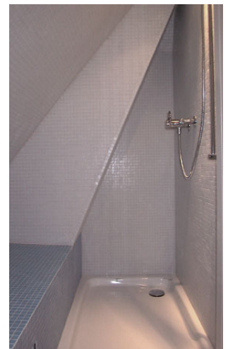
Dusche im Dachgeschoss