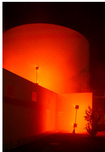
Eröffnungsfeier Themengebäude Contact