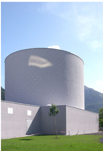
Nordansicht Themengebäude Contact

Mittels einer 3D-Projektion in der Raummitte, Bodenprojektionen und Projektionen auf die Seitenwände wird die Geschichte eines solchen Contacts vermittelt.